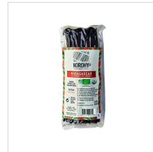
[노로히] 마다가스카르 바닐라빈