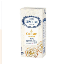
[레스큐어] UHT 휘핑크림 35% 1 L ...