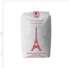
[그랑 몰랑 드 파리 (GMP)] 에펠타...