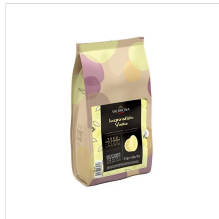
[발로나] 인스피레 이션 유자 3 kg