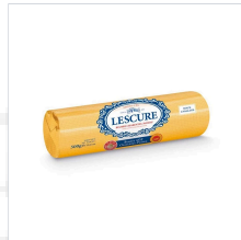
[레스큐어] 사랑트 푸아투 AOP 버터...